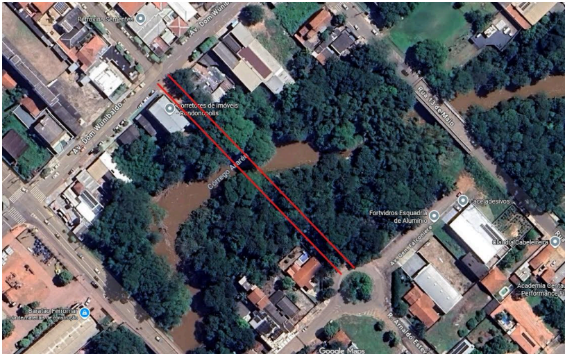
Local 02 - Avenida Lídio Magalhães e a Avenida Rotary Internacional